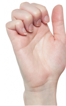
Haken Die Grundgelenke werden gestreckt. Die andern Gelenke bleiben gebeugt. Dann zurück zur Ausgangsstellung.