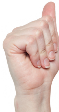
Flache Faust Nur die mittleren Gelenke werden gebeugt.