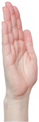
Ausgangsstellung Handgelenk und Finger sind gestreckt.

Diese Übungen sollen Verwachsungen der Sehnen mit dem umliegenden Gewebe verhindern. Mit folgenden Übungen werden Faustschluss und Fingerfertigkeit verbessert.