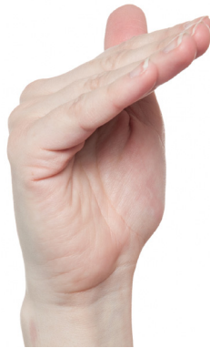
Dächli Die Grundgelenke werden gebeugt. Die Finger bleiben gestreckt.