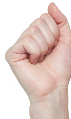
Faust Die Grund-, Mittel- und Endgelenke werden gebeugt.